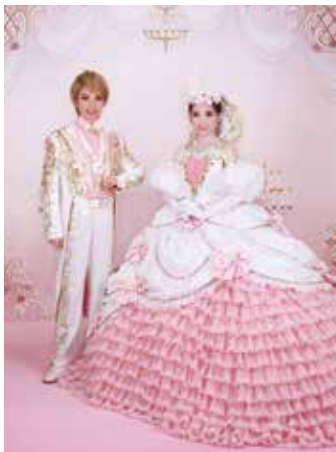
ステージスタジオで撮影した思い出の写真はミニフォトスタンドやシールに