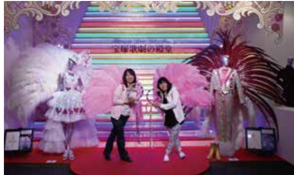
フィナーレの大階段が体験できるコーナー

2014年4月、宝塚歌劇100周年を記念して、宝塚歌劇の発展に大きな貢献をした方々を紹介する施設「宝塚歌劇の殿堂」が、宝塚大劇場内にオープン。宝塚歌劇団の卒業生およびスタッフの写真やゆかりの品々を紹介すると共に、実際の公演に使用された衣装や小道具なども数多く展示しています。また、スター気分を味わえる舞台体験コーナーもあります。