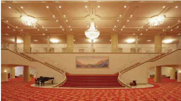
宝塚大劇場 エントランス

初演以来、宝塚市の発展と共に歴史を刻んできた宝塚歌劇。本拠地である宝塚大劇場には、全国各地から足を運ぶお客さまのために、観劇以外にも楽しめるスポットがたくさんあります。宝塚歌劇ならではの非日常感、宝塚歌劇でしかできない特別な体験を楽しんでみましょう。