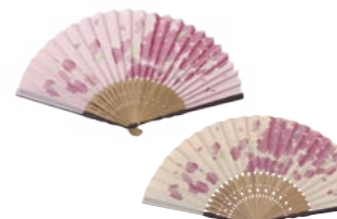
扇子 景品番号 EA8H-01500他 レオマイル 3,600LM

【紳士京扇子】●サイズ：全長約22.5cm、扇骨30間 【婦人京扇子】●サイズ：全長約19.5cm、扇骨25間 ●素材：和紙、竹●付属品：綿扇子袋●日本製