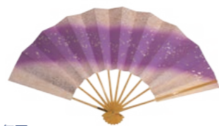
●舞扇 日本舞踊などで使われます。