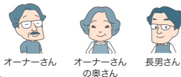
オーナーさん オーナーさんの奥さん 長男さん