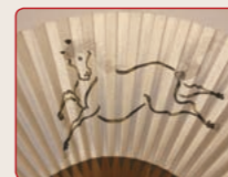
●馬 馬は本来縁起の良い動物。特に「左馬」には、倒れずに大過なく過ごせるなどの意味があります。

もともと末広りの形から縁起物とされている扇子。扇面に描かれた絵にも縁起が良いものが多く見られます。絵柄の意味を知って贈り物にすると、相手の方にも喜ばれますよ。