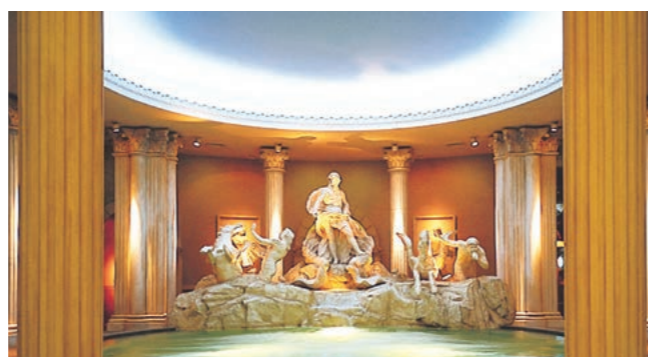
スパワールド世界の大温泉 〈大阪・大阪〉