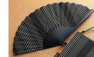
【小倉 縞縞】扇子 景品番号 EA8H-02000 レオマイル 6,400LM

●扇子サイズ：全長約20cm●扇子袋サイズ：全長約22cm●素材：[扇子]和紙、フランス麻、竹 [扇子袋]ポリエステル●セット内容：扇子、扇子袋 各1●カラー：ラグーン/銀ヘリボン、ルビー/パールピンク