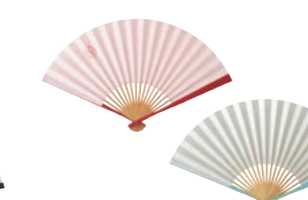
リネン巻き扇子 景品番号 AA8H-01400他 レオマイル 25,500LM

●サイズ：全長約20.5cm、扇骨25間●素材：ポリエステル、竹●中国製●カラー：黄、ピンク