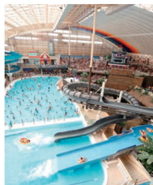
スパリゾートハワイアンズ 〈福島・いわき〉

※岩盤浴利用は別途費用必要※00:00～5:00に入館及び在館のお客様は別途深夜料金1,300円必要※特別期間については施設にお問い合わせください。