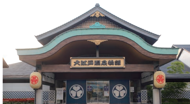
東京お台場 大江戸温泉物語 〈東京・お台場〉

クラス エルふるむな倶楽部では人気の日帰り温泉を特別優待でご利用できます。暑い残暑をご家族でお楽しみください。