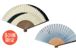
【白竹堂】京扇子 景品番号 EA8H-03100他 レオマイル 6,100LM

【紳士京扇子】●サイズ：全長約22.5cm、扇骨30間 【婦人京扇子】●サイズ：全長約19.5cm、扇骨25間 ●素材：和紙、竹●付属品：綿扇子袋●日本製