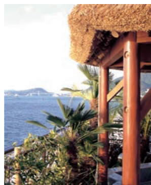
もじ楽の湯 〈福岡・北九州〉