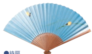
●持扇 涼を取るためにおおぐ一般的な扇のこと。夏扇とも呼ばれます。