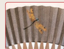
●蜻蛉(トンボ) 前にしか進まないということで「不退転」の意味となげ、勝ち虫と呼ばれています。