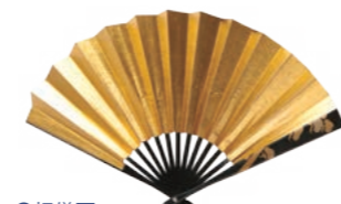
●祝儀扇 結婚式などのおめでたい場で持つ礼装用の扇子。開いておおぐことはありません。