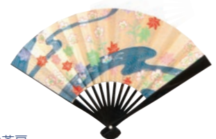
●茶扇 茶道のお茶会で用いられます。流派によりますが、女性用で15cm前後の長さが主流。