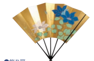
●飾り扇 部屋などに飾って楽しむために作られた扇子。