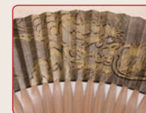
●龍 どんどん上昇する昇り龍は、運氣上昇や出世を意味すると言われます。